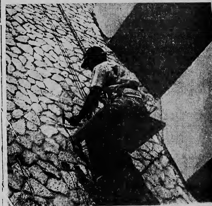
E di dos foto ta duna un bista dje muraya exterior, cual tin un parti cu ta consisti di piedra natural, cual despues cu ta yega mester hanja un ultimo terminacion ainda. Nos ta mira con un dje obreronan di Taylor ta trahando cu pasenshi.